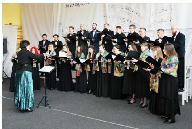
Chór mieszany „INSIEME” z Krakowa