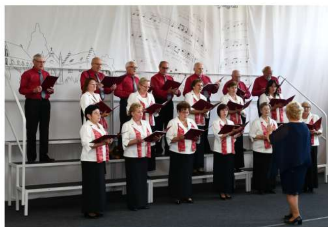
Chór mieszany „LUTNIA” z Pszczyny