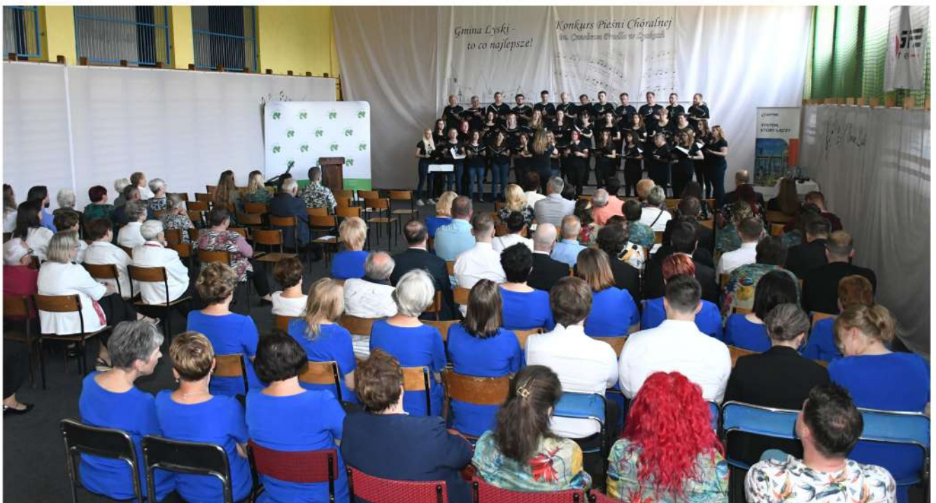
Akademicki Chór Uniwersytetu Łódzkiego