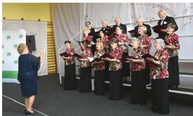
Chór mieszany „ZORZA” z Gminy Wyrzy