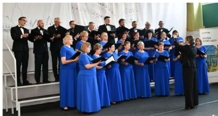
Chór mieszany „CANTEMUS” z Pszczyny