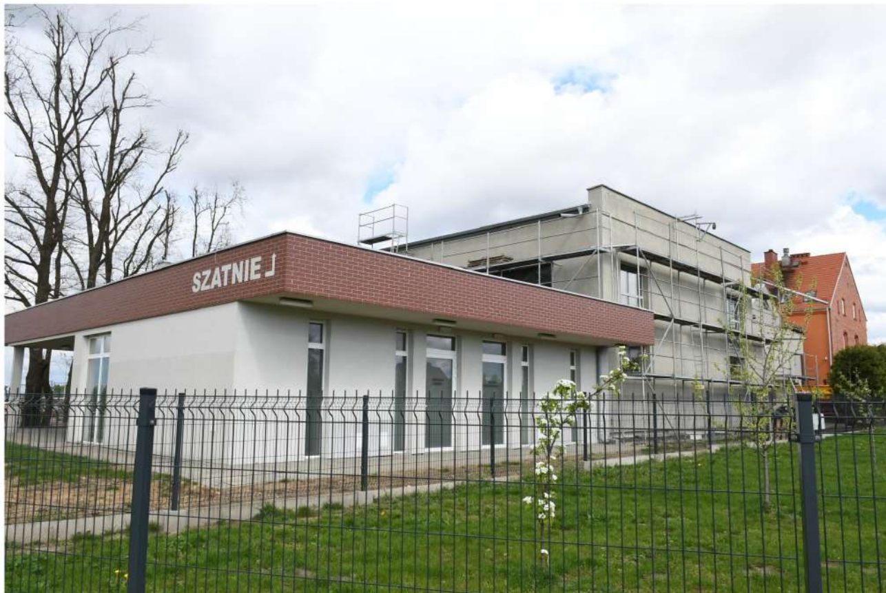
PROJEKT SALI GIMNASTYCZNEJ W RASZCZYCACH WIZUALIZACJA 1 i 2