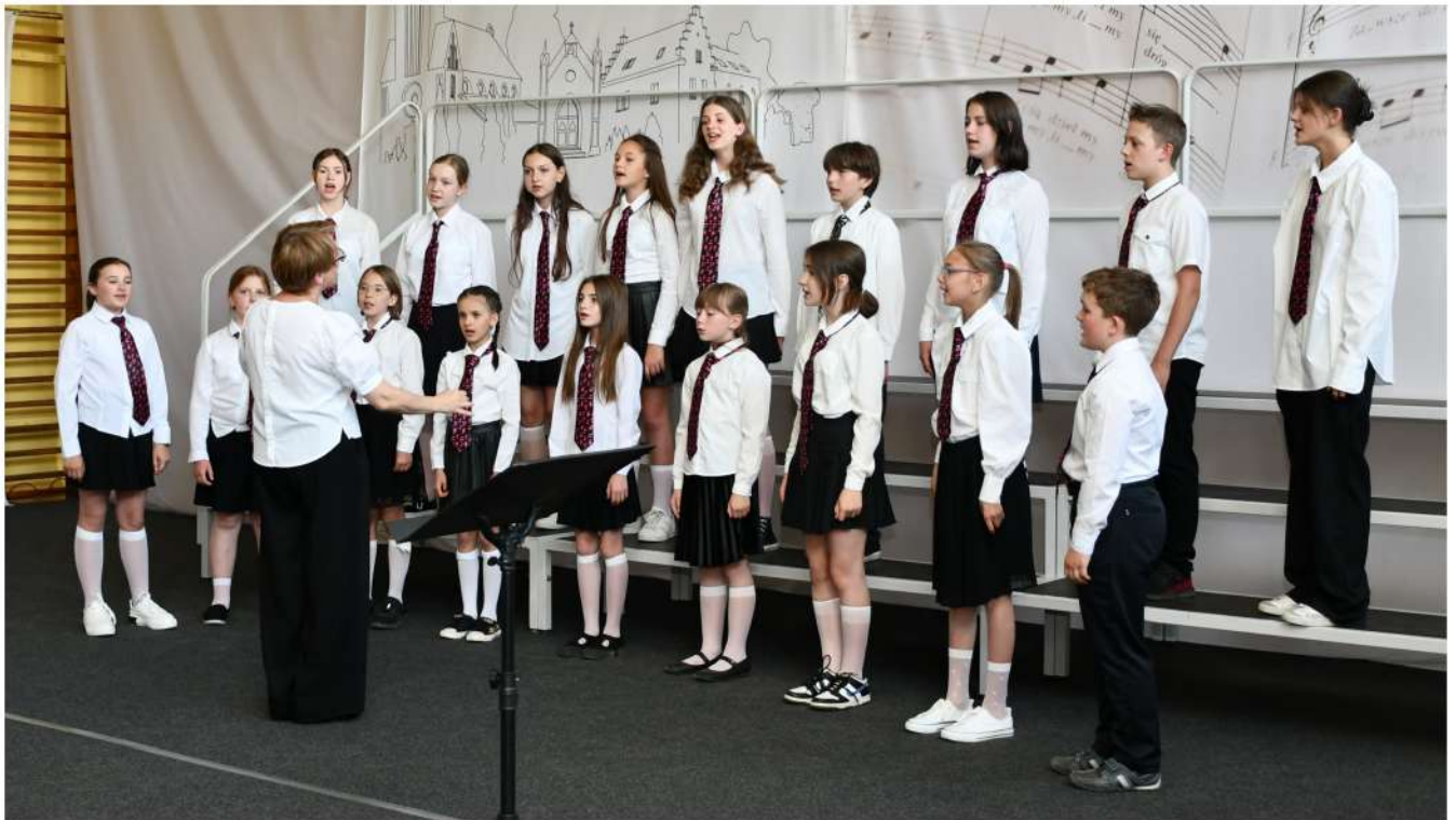
Chór dziecięcy „PIANO FORTE” z Radostowic